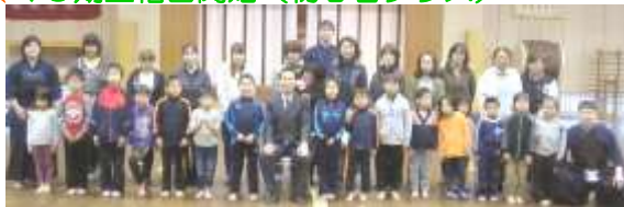
期待を胸に先生方と記念写真〜ハイチーズ!