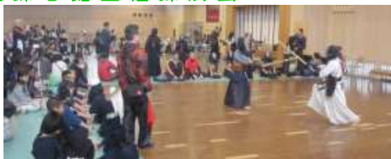
※計19団体参加・約700名が参加