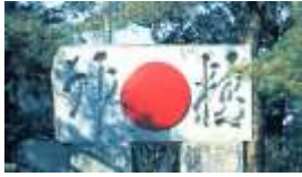
—解脱会太陽精神碑—