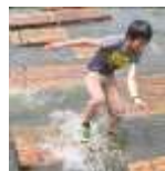
わ～ 足が池に・・・②