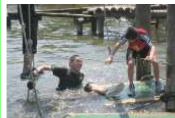
助けてくれ！先輩大丈夫ですか？