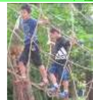
このロープ 揺れるな・・・