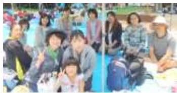
保護者班で記念写真！