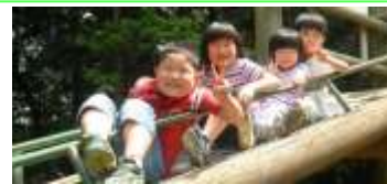
新入門生で～す剣道頑張ります！