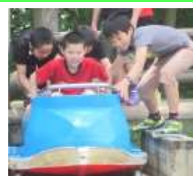
まだ押さないで！ やだよ～押しちゃいます