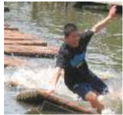
わ～足が池に・・・①