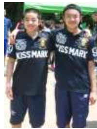
え・・・偶然？ ペアールック！③