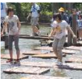
錬心館最強コンビ！ 私達は絶対落ちません！