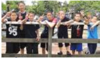
ピース！中学1年集合！