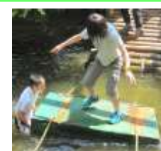
落としてあげるね うわ～やめて！