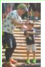
落ちたら大変！ 大丈夫？