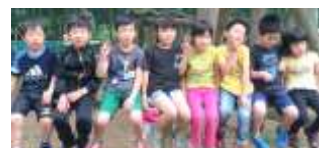
小学1年生集合で～す