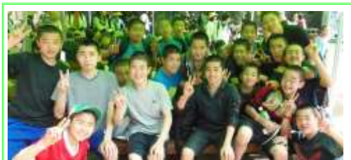
中学生男子集合で～す