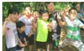
小学3年生集合で～す