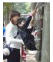
最後まで がんばるぞ！