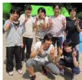
中学女子集合で～す