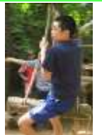
やっほ～ 気持ちいい①