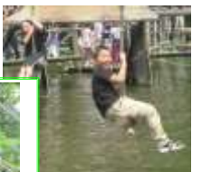
やっほ～ 気持ちいい②