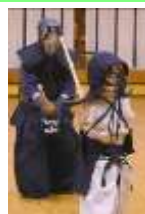
打ち込み稽古④ さ～こい！