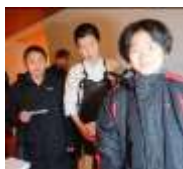
おはようございま す～！皆勤まであ と・・・