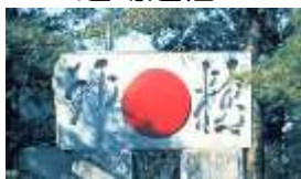
—解脱会太陽精神碑—