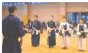
寒稽古納め！① 表彰代表4名