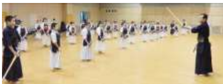
素振りの大切さを 館長先生よりご指導頂きました！