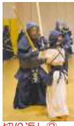
切り返し② 左右面を正確 に！