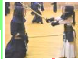
打ち込み稽古⑤ 正しく・メーン！