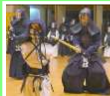
打ち込み稽古⑦ よーし次は僕の番！