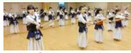
正面素振り②先生からの教えを意識して！