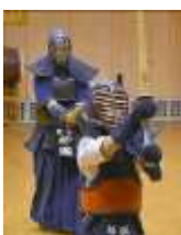
打ち込み稽古③ まだ・まだ！ さあ～頑張れ！