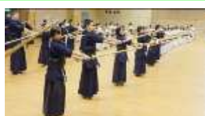
正面素振り① 正しくメン