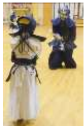
切り返し① 構えを直し