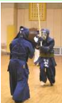
まだまだ！若い者に は負けません！