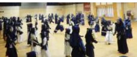
大勢の元立ちの先牛方毎日有難うございます