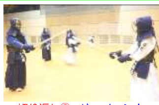
切り返し③ や～メーン！