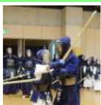
打ち込み稽古② 左手の使い方を 意識して！