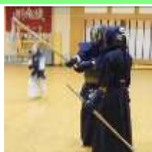
打ち込み稽古① 正しく正確に！