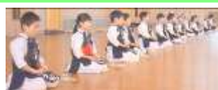
夕方の部！①稽古開始・黙想