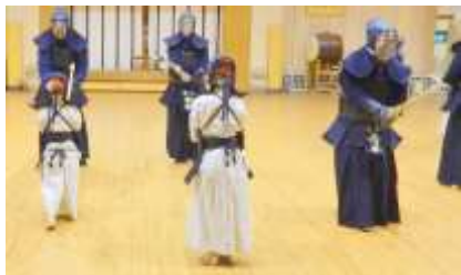
大勢の元立ちの先生に さ～あ！稽古開始