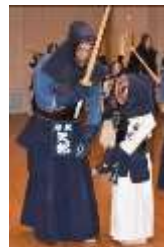
打ち込み稽古④ 左足に注意！