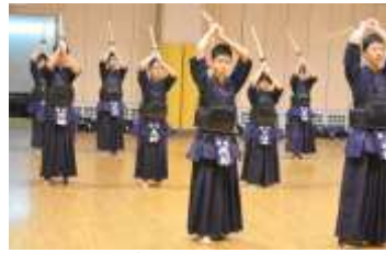
素振り① 正しくメン