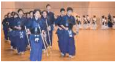
気合を入れて 駆け足1・2！ソーレー！