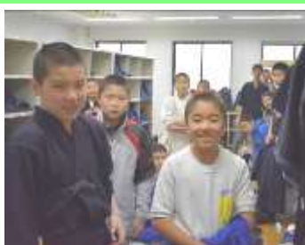
寒稽古納め！③ 寒稽古終了の達成感で最高の笑顔！