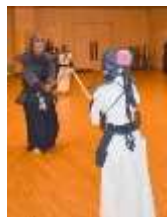
打ち込み稽古⑧ さあ～頑張れ！