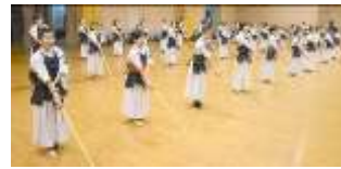
素振り② 先生からの教えを意識して！