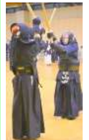
打ち込み稽古⑦ 正しく・メン！