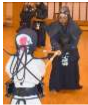
打ち込み稽古⑨ さ～こい！