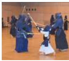
打ち込み稽古② 左手の使い方を 意識して！