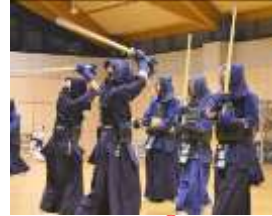
切り返し② 左右面を正確に！