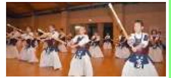
素振り③腰を落としてメン！ う・・・きつい！