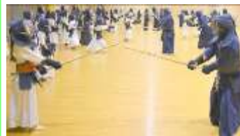
ラスト1本！ファイト！