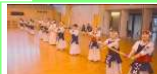
夕方の部！⑥ 姿勢も立派！