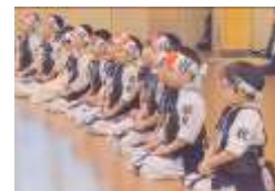
夕方の部！② 稽古開始・黙想