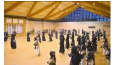
大勢の元立ちの先生方 毎日有難うございます