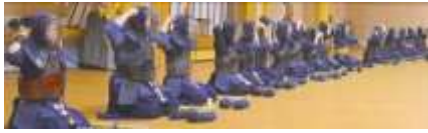
大勢の元立ちの先生に さ～あ！稽古開始