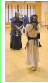
打ち込み稽古⑤ 気合だ～！