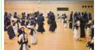
切り返し③気迫で負けない！