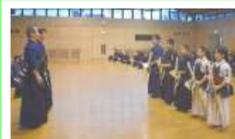
寒稽古納め！① 表彰代表5名