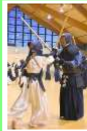
打ち込み稽古⑥ 正しく体当たり