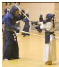
打ち込み稽古③ 刃筋正しく！めん！