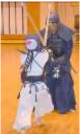
打ち込み稽古① 正しく正確に！