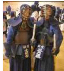
まだまだ！若い者には 負けません！