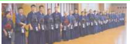
寒稽古納め！② 先生方ありがとうございました！