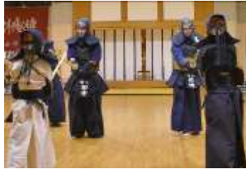
切り返し① 構えを正しく